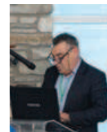
Πέτρος Βαφινίδης δήμαρχος Αλοννήσου